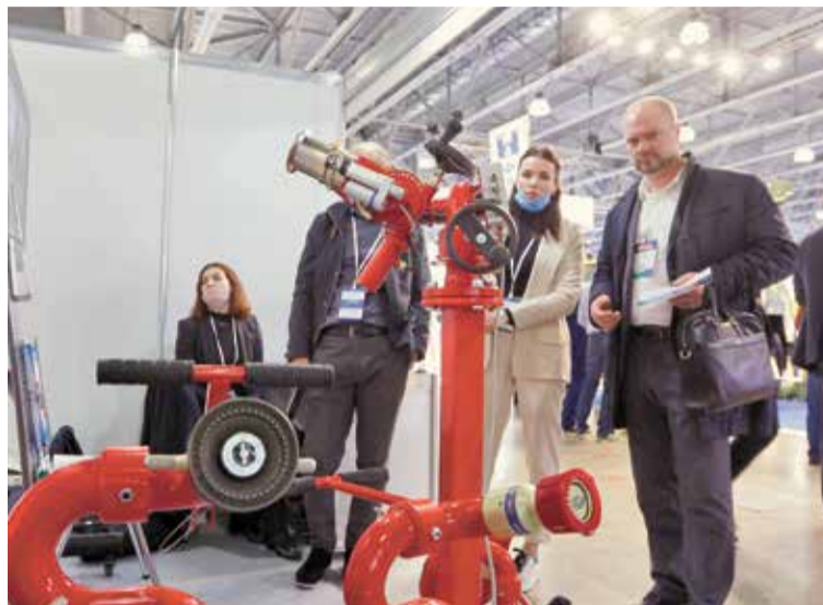
Современное противопожарное оборудование неизменно вызывает высокий интерес у посетителей научно-технических салонов

Это особенно важно с позиций достижения информационного превосходства и формирования надежной системы обеспечения информационной безопасности в условиях глобального цифрового пространства.