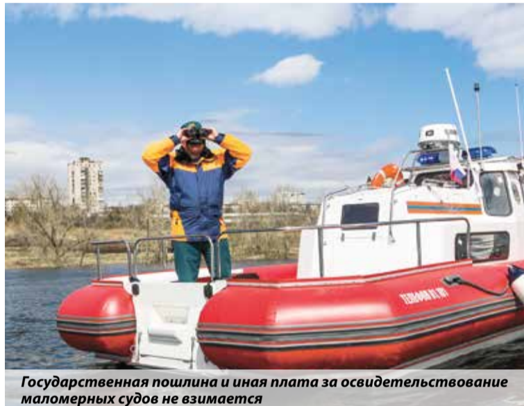
Государственная пошлина и иная плата за освидетельствование маломерных судов не взимается

в специально изданных информационных материалах. Можно лично обратиться в ближайшую инспекцию по маломерным судам.