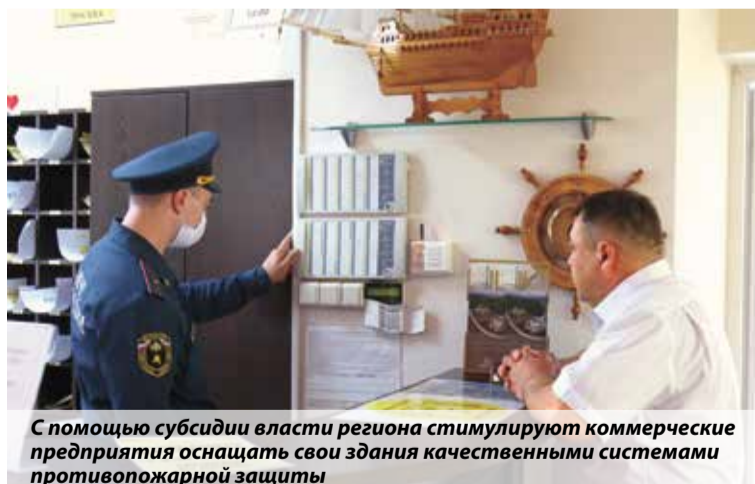
С помощью субсидии власти региона стимулируют коммерческие предприятия оснащать свои здания качественными системами противопожарной защиты

В результате было издано постановление правительства Алтайского края № 324 «Об утверждении Порядка субсидирования части затрат, связанных с приобретением субъектами малого и среднего предпринимательства оборудования в рамках реализации индивидуальной программы социально-экономического развития Алтайского края на 2020–2024 годы, утвержденной распоряжением Правительства Алтайского края от 08.04.2020 № 928-р».