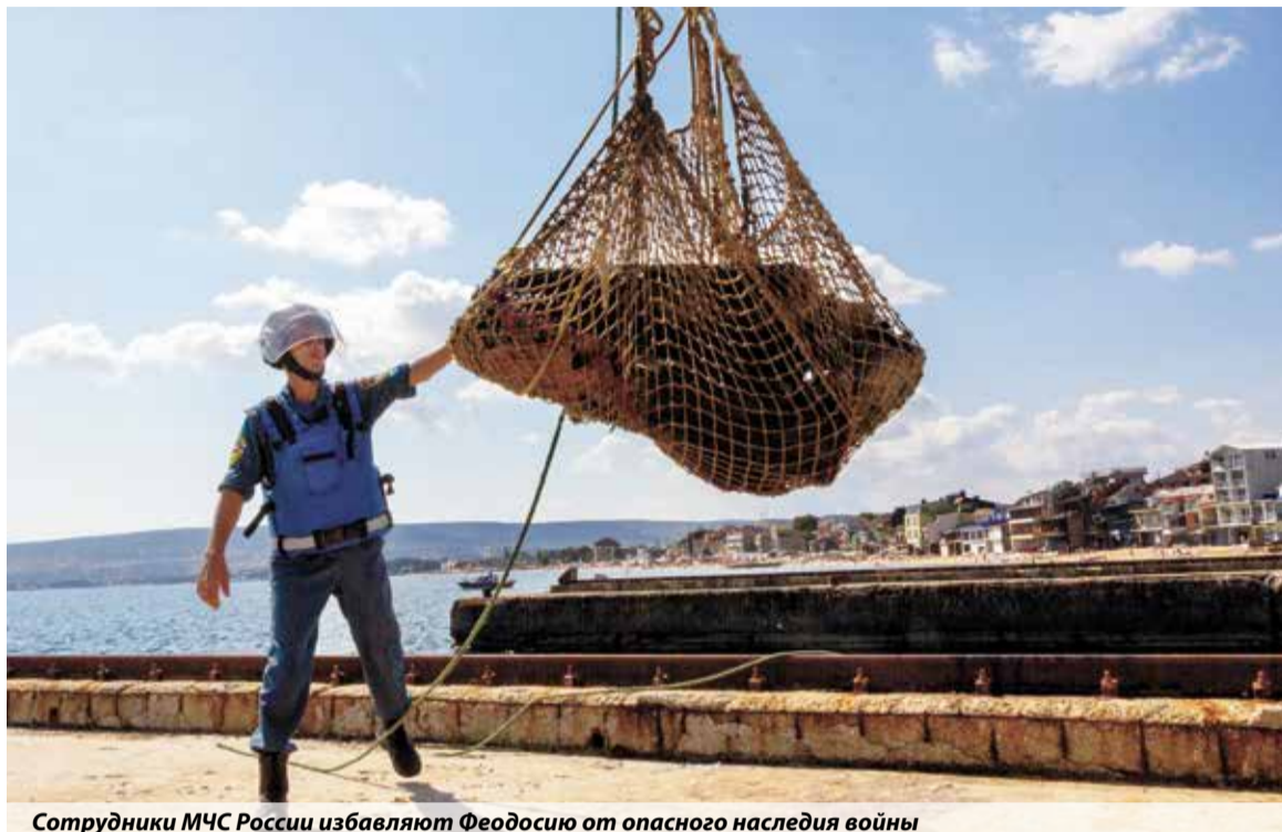
Сотрудники МЧС России избавляют Феодосию от опасного наследия войны

В Крыму завершился очередной этап разминирования затонувшего в годы Великой Отечественной войны теплохода «Жан Жорес»