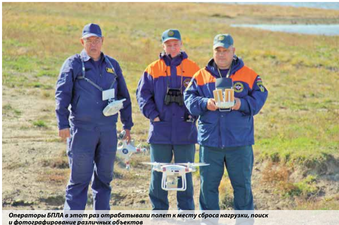
Операторы БПЛА в этот раз отработывали полет к месту сброса нагрузки, поиск и фотографирование различных объектов

Екатерина Потворова Фото Натальи Шуваловой Пресс-служба ГУ МЧС России по Хабаровскому краю