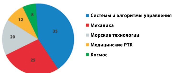
Основные направления исследований и создания робототехнических комплексов военного, специального и двойного назначения