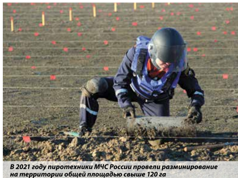
В 2021 году пиротехники МЧС России провели разминирование на территории общей площадью свыше 120 га

онной, химической и биологической защиты, где участники показали навыки по ведению разведки, оказанию первой помощи пострадавшим, надеванию средств индивидуальной защиты органов дыхания и зрения, работе в условиях установленных минно-взрывных заграждениях. Помимо