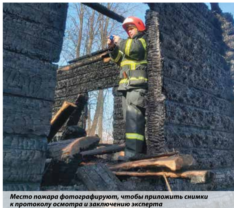
Место пожара фотографируют, чтобы приложить снимки к протоколу осмотра и заключению эксперта

Приходится изучать много специальной литературы, ГОСТов, приказов, инструкций. И как показывает практика, несмотря на огромную законода-