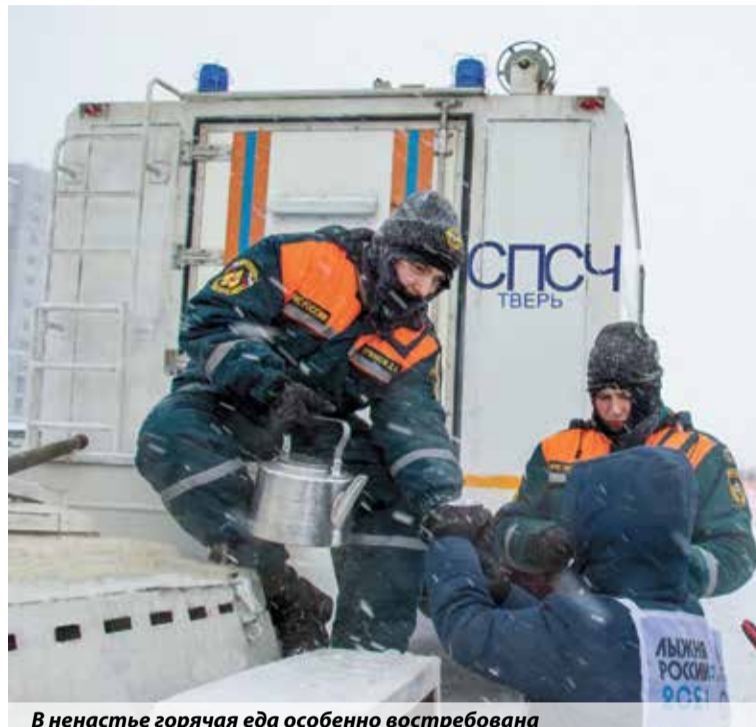
В ненастье горячая еда особенно востребована

Виктория Ротарь, пресс-служба ГУ МЧС России по Тверской области