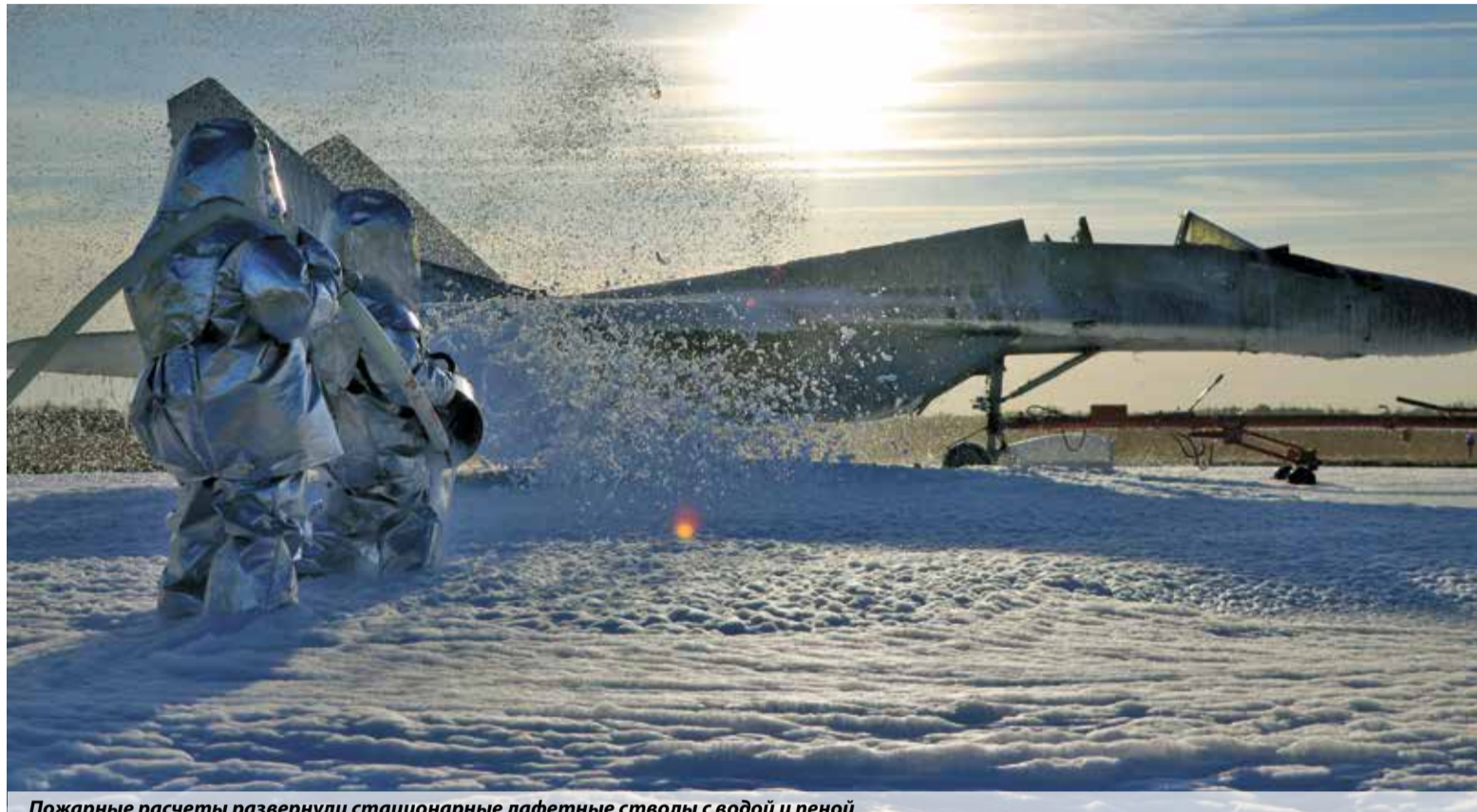
Пожарные расчеты развернули стационарные лафетные стволы с водой и пеной

Аварийный борт встречали пожарные расчеты войсковой части. Они произвели боевое развертывание стационарных лафетных стволов с водой и пеной, а также организовали спасение пилота. Для этого пришлось быстро установить пожарную лестницу и с помощью аварийно-спасательного инструмента вскрыть фонарь самолета. Прибывшие отделения Главного управления МЧС России организовали резерв-