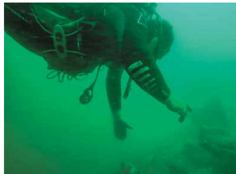
В общей сложности водолазы-пиротехники провели под водой время, равное 11 суткам

«Все работы по разминированию производились внутри трюмов, в замкнутом пространстве, причем основная часть боеприпасов находится под толщей ила. То есть при первом спуске еще что-то видно, но после начала размывки видимость становится просто нулевой. Водолазы работали буквально на ощупь. У каждого из нас свои ориентиры и хитрости по выходу из трюма, если вдруг возникнет аварийная ситуация. Но, слава богу, обошлось без происшествий.»