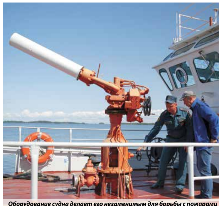
Оборудование судна делает его незаменимым для борьбы с пожарами

Виталий Романов