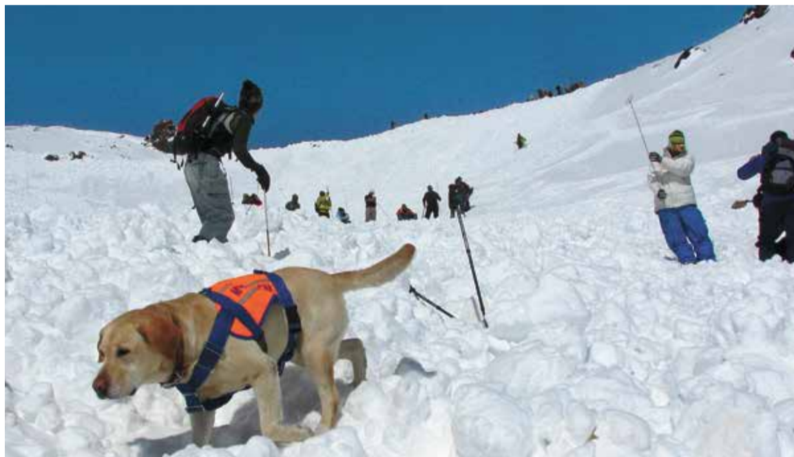
К спасательным работам в горах нередко привлекают специально обученных собак

Деятельность МЧС России в сфере горнолыжного туризма регламентируется нормативными правовыми актами, в том числе приказом МЧС России от 30 января 2019 года № 42 «Об утверждении Порядка информирования территориальных органов МЧС России о маршрутах передвижения, проходящих по труднодоступной местности, водным, горным, спелеологическим и другим объектам, связанных с повышенным риском для жизни, причинением вреда здоровью туристов (экскурсантов) и их имуществу, и Порядка хранения, использования и снятия с учета территориальными органами МЧС России информации о маршрутах передвижения, проходящих по труднодоступной местности, водным, горным, спелеологическим и другим объектам, связанных с повышенным риском для жизни, причинением вреда здоровью туристов (экскурсантов) и их имуществу». Этот документ позволил МЧС России значительно снизить риски, связанные с активным туризмом, повысить оперативность реагирования в случае происшествий с туристами, занимаю-