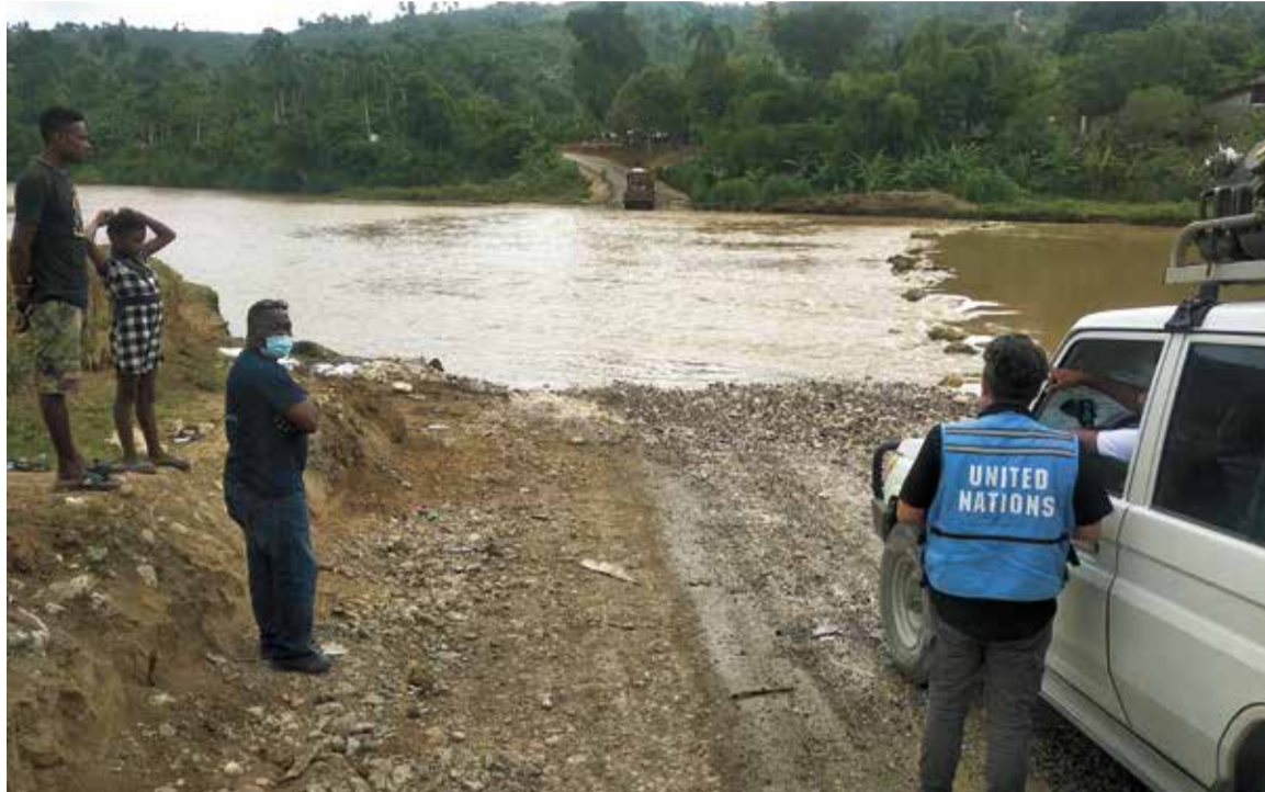
Гаитянские водители готовы были рисковать жизнью ради выполнения поставленной перед ними задачи

Для этого я нашел единомышленников, надел форму МЧС и отправился сотоварищи в наш педагогический институт. Мы провели рабочую встречу с преподавательским составом вуза и попросили подготовить для нас программу изучения английского с акцентом на специфику спасательного дела. Они нашу просьбу выполнили, и мы втроем в течение года и днем, и вечером ходили учиться. Два года назад я был выбран кандидатом на обучение по программе ООН в Индонезии в город Сентул, где успешно прошел курс подготовки и получил статус члена UNDAC. С тех пор нахожусь в резерве. И вот состоялась моя первая командировка, в ходе которой я смог применить полученные знания.