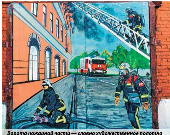
Ворота пожарной части — словно художественное полотно

— Макет разрабатывался при помощи разных фото-