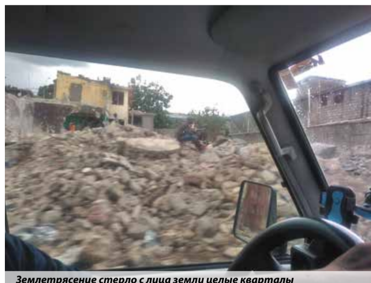
Землетрясение стерло с лица земли целые кварталы