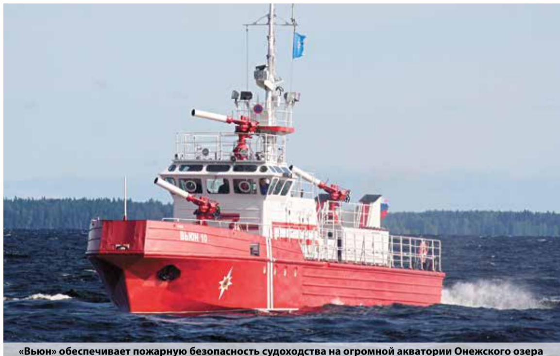
«Вьюн» обеспечивает пожарную безопасность судоходства на огромной акватории Онежского озера

Закончив приемку, мы вышли в Петрозаводск. Наш путь лежал через Череповец и Вытегру. Стояла уже глубокая осень, на воде была волна, вечером опускались туманы, и мы вместе с командой приняли решение идти домой только в светлое время суток. Ближе к вечеру бросали якорь, ловили рыбу, варили уху, ужинали и отдыхали. С рассветом — снова в путь. Вот так, не спеша, без всяких приключений за три дня дошли до Петрозаводска, где уже нас встречало руководство УГПС МВД по Республике Карелия. Все с неподдельным интересом осматривали