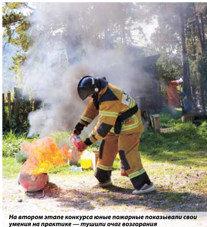
На втором этапе конкурса юные пожарные показывали свои умения на практике — тушили очаг возгорания

Организаторами соревнований выступили Алтайское республиканское отделение Всероссийского добровольного пожарного общества, ГУ МЧС России по Республике Алтай и министерство образования региона. В смотре-конкурсе принимали участие девять дружин юных пожарных из разных районов Алтая.