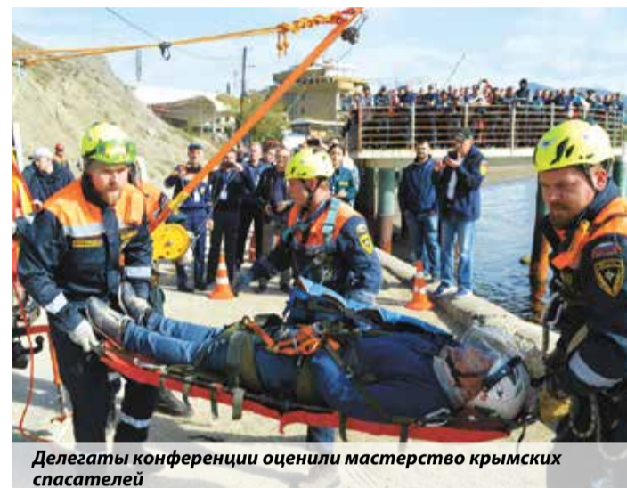
Делегаты конференции оценили мастерство крымских спасателей

Представители аварийно-спасательных служб и формирований обсудили насущные вопросы повседневной деятельности