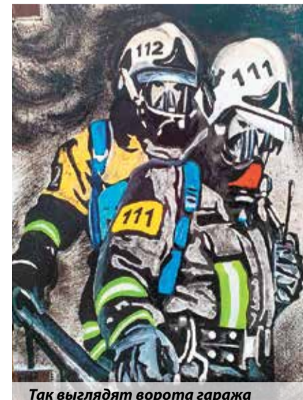
Так выглядят ворота гаража

графий с учений и пожаров. Он складывался в голове как пазл. На создание рисунка ушло несколько месяцев. Все ра-